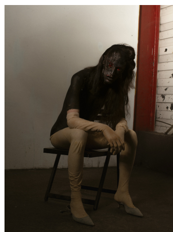
Constant Fossard à travers la Gouvernante Tribute, 2023 © Mathilda Gustau