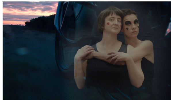
Astré DESRIVES Héroïnes, 2023 © Astré Desrives