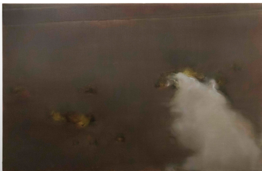
France PARSUS Larmes (sol nantes 2), 2021 © France Parsus