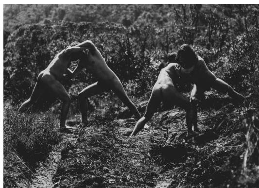
Jorge CONCHA Jouons à un jeu de... # 1, 2020